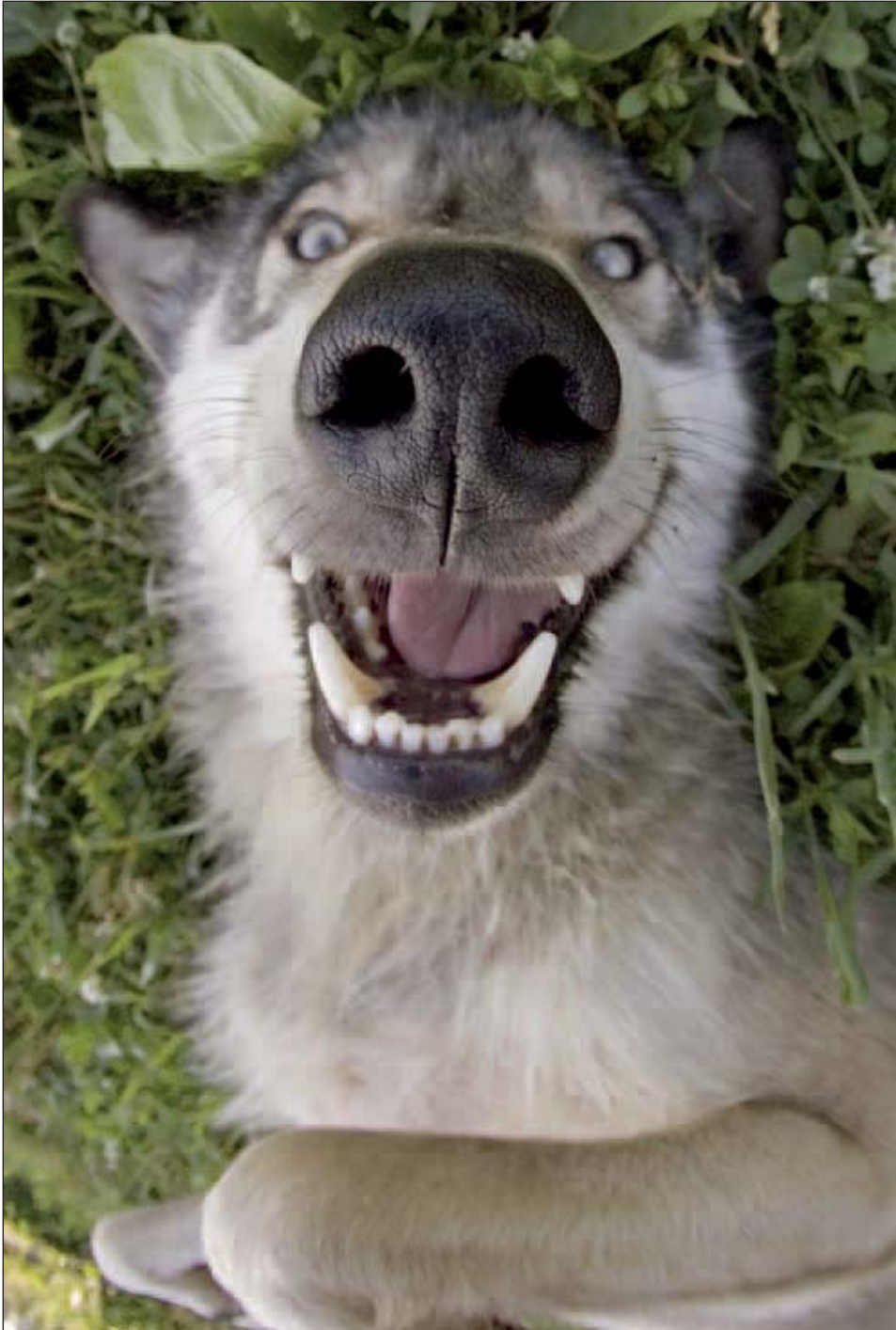
(© Monty Sloan)